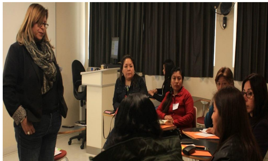
Discusión entre padres en Lima.