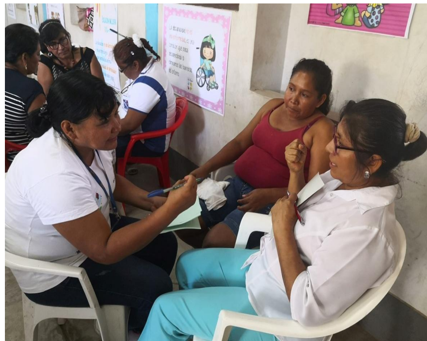
Maestras reflexionando juntas en el taller de Pucallpa.