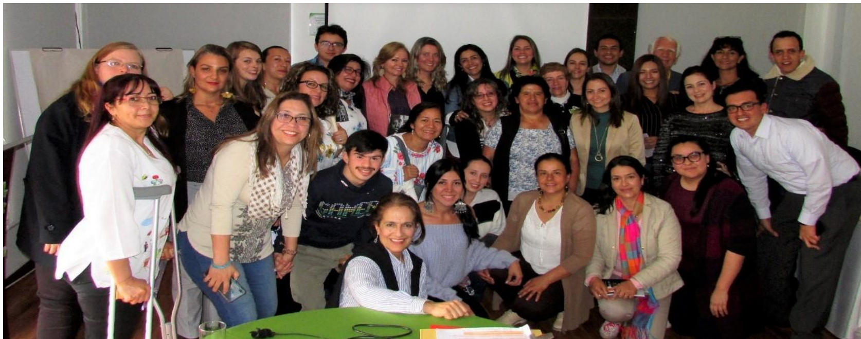
Participantes del taller en Bogotá: 'sí se puede'

vida en la que los talentos de todos sean apreciados. Esto señala la necesidad de un currículo diverso y flexible, estrategias personalizadas para el aprendizaje y una cultura que celebre toda la diversidad estudiantil.