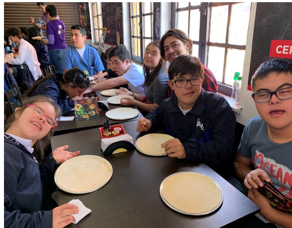
Estudiantes en el Liceo VAL, Bogotá

En su libro Escuelas Creativas (Grijalbo, 2016), el distinguido pedagogo británico Sir Ken Robinson, ofrece una definición radicalmente diferente: el propósito de la educación es 'permitirles a los estudiantes a entender el mundo a su alrededor y los talentos dentro de sí mismos para que puedan convertirse en individuos satisfechos y ciudadanos activos y compasivos'. La educación es para toda la vida – aprendiendo la mejor manera de vivir en armonía con nosotros mismos, con los demás y con el mundo natural y así hacer de nuestra parte para alcanzar un mejor futuro para las personas y el planeta. La inteligencia abarca mucho más que la habilidad académica: nos desarrollamos como personas plenas que puedan contribuir eficazmente a un mundo laboral cambiante y, además, apreciar la diversidad cultural, comprender a la sociedad y participar positivamente en nuestras comunidades. Si ésta es nuestra meta, debemos promover una educación que tenga: 1) un currículo amplio y flexible; 2) estrategias creativas y personalizadas para el aprendizaje; y 3) una cultura que celebre toda la diversidad de sus estudiantes.